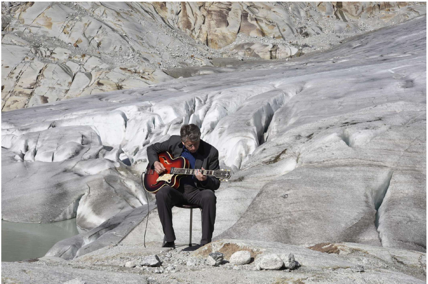
George Steinmann, «Symbioses of Responsibility» 30/11 au 08/12 2015, Le Bourget + Grand Palais (photo by Tabea Reusser on Rhone Glacier, 2015)

« Après 10 années d'engagement contre les causes et effets du changement climatique nous sommes toujours convaincus que l'Art est un médium puissant pour transmettre au grand public les causes et conséquences du changement climatique. L'art rassemble et permet une meilleure compréhension des solutions durables à apporter. Cela est d'autant plus valable aujourd'hui après les événements tragiques récemment survenus à Paris. L'art peut également être un véhicule de connaissances, nous aider à apprécier l'altérité et établir un dialogue plus profond avec notre existence afin de créer un meilleur futur pour la planète et l'humanité. »